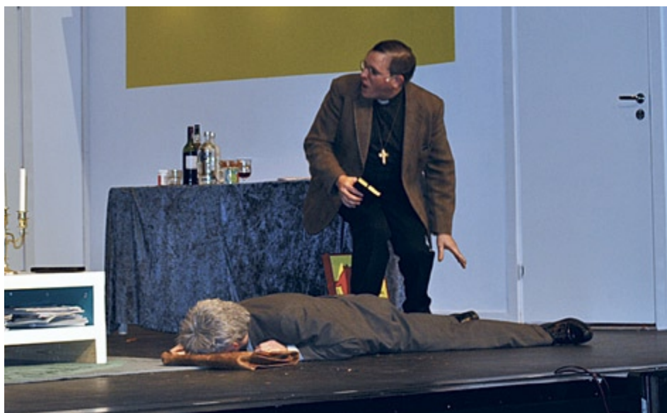
Politikern, alias Gummi-Gunnar, somnar överallt och prästen skyttar ljuset i pärleporten.

Som sig bör fars det ut och in genom dörrar i olika förvecklingar, vilket är det speciella som kännetecknar en fars. Men det handlar inte om att se ljuset i tunneln, snarare om att i en modern version undvika att få ljuset i rumpan.